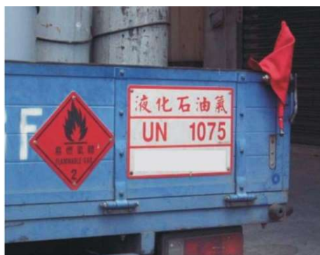
左、右兩側及後方懸掛或黏貼危險物品標示及標示牌、車頭及車尾懸掛布質三角紅旗之危險標示。