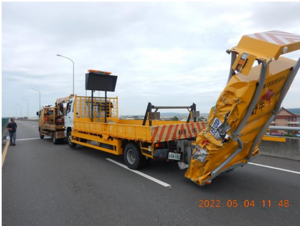
罹災者林○○搭乘之巡查車